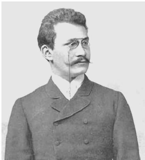
Rys. 7. Hermann Minkowski (1864–1909)

jak rzeczywistość Cezanne'a. Dopiero Hermann Minkowski (rys. 7) podał piękne, jednolite sformułowanie szczególnej teorii względności w ramach nieeuklidesowej geometrii czterowymiarowej.