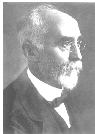
Rys. 6. Hendrik Antoon Lorentz (1853–1928) jest uznawany za najwybitniejszego fizyka holenderskiego. „Ratując” teorię Maxwella, wprowadził pojęcie czasu lokalnego i po raz pierwszy zapisał prawa dziś nazywane transformacją Lorentza.

w swoich martwych naturach próbował zmierzyć się z problemem jednoczesnego przedstawienia zdarzenia (układ naczyń i owoców w konwencjonalnym zestawie martwej natury) widzianego przez różnych obserwatorów, a więc symultanicznie pokazującego obiekty w różnej perspektywie i z różnym horyzontem (patrz np. www.artofeurope.com/cezanne/cez3.htm ). Podobnie można interpretować geometrię sławnego Śniadania na trawie Maneta (patrz np. www.impresjonizm.art.pl/manet/manet12.jpg ). Każda z osób na tym obrazie widzi inny horyzont (co można poznać po różnej orientacji oczu postaci). Ponadto perspektywa obrazu zakłócona jest przez kąpiącą się postać w drugim planie obrazu.