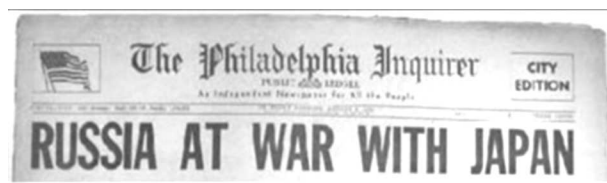
Rys. 1. Czołówka The Philadelphia Inquirer z 1905 r.

Jak wyglądał świat sto lat temu? Czym żyli ówczesni czytelnicy gazet interesujący się wydarzeniami na świecie? 25 maja 1905 r. admirał Rożestwieński i jego Flota Bałtycka, duma cesarstwa Rosji, zbliżała się do wysp Cuszima. Wysłana jesienią roku 1904 Flota spieszyła na odsiecz okrążonej przez Japończyków twierdzy Port Artur. Czytelnicy prasy na całym świecie od miesiący widzieli na pierwszych stronach swoich gazet tytuły „Rosja i Japonia w stanie wojny” (rys. 1).