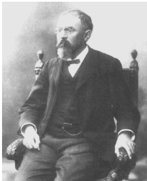
Rys. 3. Henri Poincaré (1854–1912)

Uzyskane w Aarau wykształcenie humanistyczne Einstein pogłębiał i poszerzał w założonym przez kilku równie młodych jak on pracowników – jak dziś po-